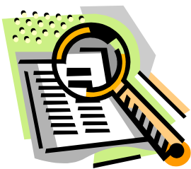
Didascalia dell'immagine o della fotografia

Questo brano può contenere 175-225 parole.